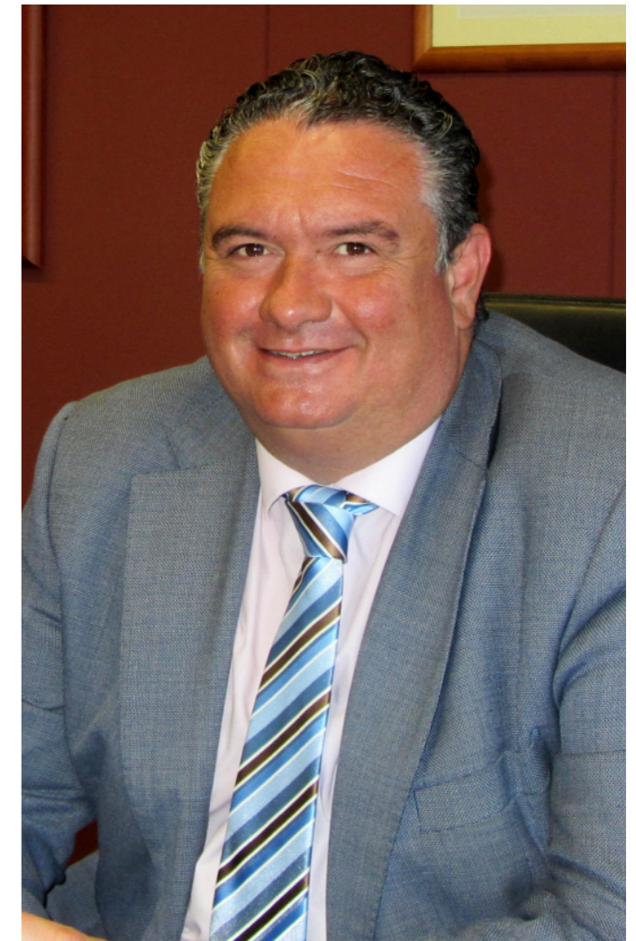
Bartolomé González, presidente de la Confederación de Empresarios.

Uno de los asuntos en los que la memoria de 2022 pone el foco es el reto demográfico. En efecto, Jaén lleva años afrontando una tendencia demográfica regresiva con saldos migratorios negativos a razón de 5.000 habitantes por año. Este es un fenómeno detrás del cual se encuentran muchos factores, cuantitativos y cualitativos, estructurales y culturales. No es tampoco, un fenómeno nuevo en la provincia. Y en esta tendencia progresiva, la pérdida continuada de población joven cualificada es la mayor amenaza que encaramos. Es una realidad bastante compleja que demanda una buena planificación de las políticas públicas: aprovechamiento de los recursos que se ofrecen, nichos de empleo relacionados con el capital educativo, distribución de servicios, infraestructuras y equipamientos de manera equitativa. En definitiva, una estrategia integral asentada en un modelo de desarrollo territorial más equilibrado. Tampoco, y así también lo señala el documento, ayuda nuestro mapa de carreteras o de infraestructuras energéticas y de información, debilidades identificadas siempre en el desarrollo de algunos sectores productivos.