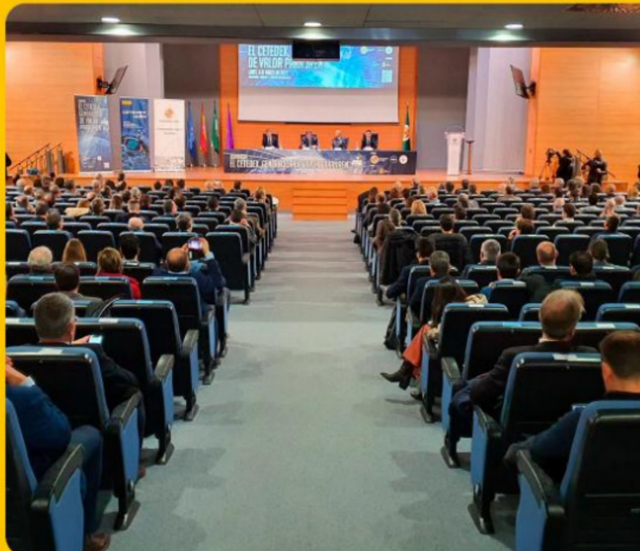
Portada de la 'Memoria sobre la situación socioeconómica y laboral de la provincia de Jaén 2022' con el CETEDEX como protagonista.