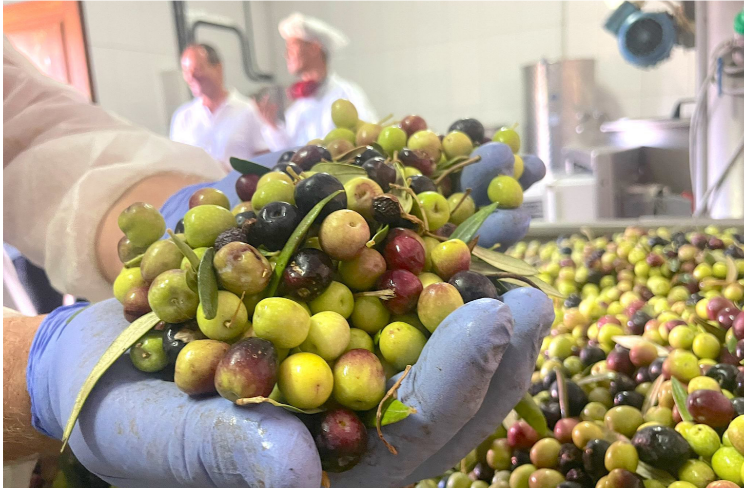
La recolección de aceituna y elaboración de aceite de oliva virgen extra ocupa a buena parte de la población jiennense.