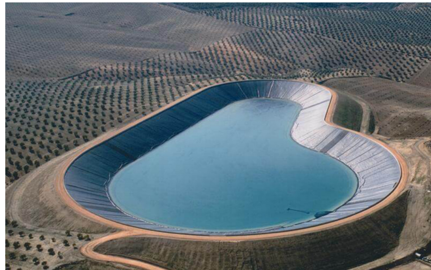
Una balsa de riego es un sistema artificial de almacenamiento de agua que se usa para cubrir las necesidades de riego en períodos de escasez.

El Consejo Económico y Social de la provincia de Jaén ha publicado un informe titulado La reconversión de explotaciones agrarias y adaptación de las comunidades de regantes . El trabajo, elaborado por la Asociación Agraria de Jóvenes Agricultores (ASAJA), pone el foco en la problemática actual que apunta a que muchos agricultores, cuyas explotaciones pertenecen a comunidades de regantes, se encuentran con su oposición a la hora de modernizar sus explotaciones agrarias, pasando de un olivar tradicional a un olivar intensivo o superintensivo. Esta oposición se produce, sobre todo, en comunidades de regantes que todavía cuentan con un sistema de riego antiguo, como el riego