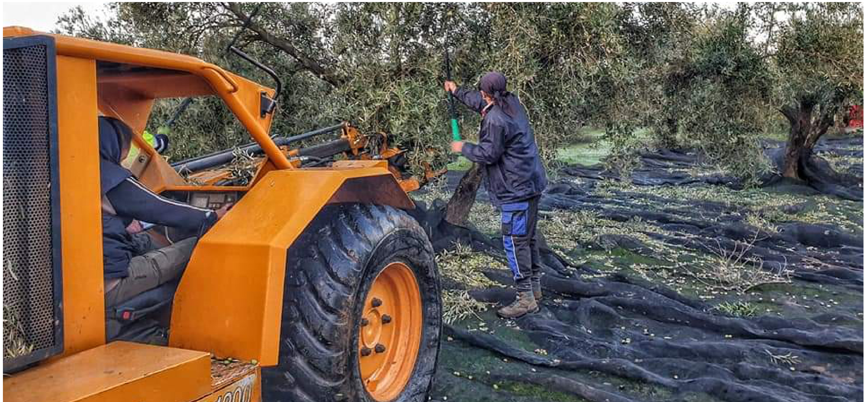
Los diez municipios jiennenses con mayor número de explotaciones agrarias según los datos recogidos en el censo de 2020 son Martos (3.324), Alcalá la Real (3.032), Úbeda (2.692), Alcaudete (2.537), Baeza (2.156), Villacarrillo (2.134), Jaén (2.033), Torredelcampo (1.194), Porcuna (1.798) y Quesada (1.565).

(81), Hinojares (92), Santiago Pontones (135), Larva (148), Jamilena (154), Escañuela (167), Noalejo (199) y Carboneros (206). Por tamaño medio de la explotación de cultivos leñosos, los 10 municipios con mayor número medio de tamaño de explotación son Espeluy (35,60 ha/exp), Linares (16,33 ha/exp), Cabra del Santo Cristo (14,85 ha/exp), Cazalilla (13,14 ha/exp), Jaén (12,53 ha/exp), Montizón (12,15 ha/exp), Fuerte del Rey (11,98 ha/exp), Úbeda (11,75 ha/exp), Jabalquinto (11,63 ha/exp) y Villanueva de la Reina (11,60 ha/exp). Los 10 municipios con menor tamaño medio de explotación de cultivos leñosos son Albánchez de Mágina (2,41 ha/exp),