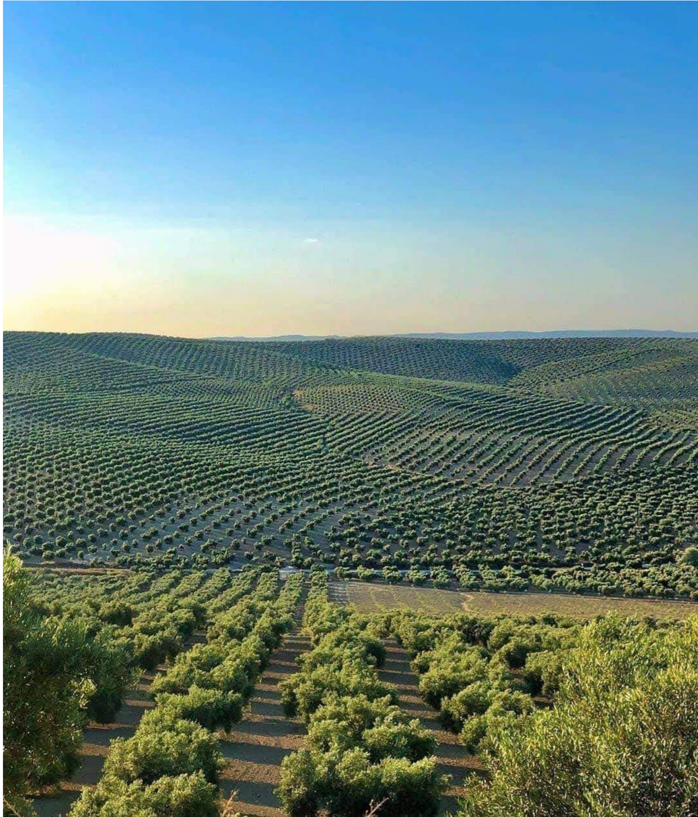
La mayoría de las explotaciones agrícolas localizadas en la provincia de Jaén están dedicadas al cultivo del olivar.