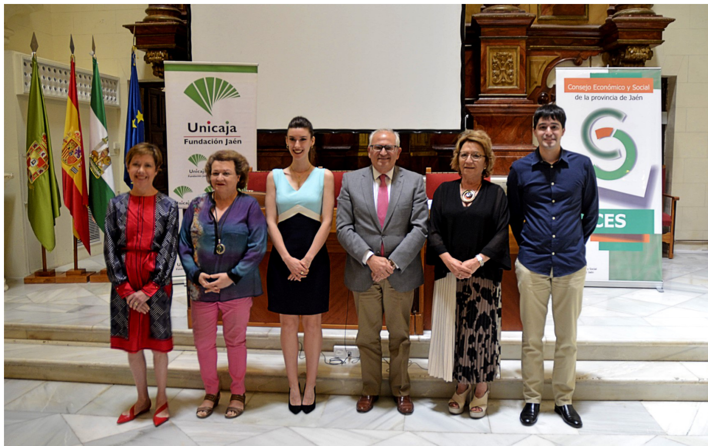
Foto de familia con los ganadores de la anterior edición del Premio de Investigación del CES provincial de Jaén y Fundación Unicaja Jaén.

El Consejo Económico y Social de la provincia de Jaén, en colaboración con la Fundación Unicaja Jaén, ha convocado el X Premio de Investigación . Este prestigioso premio, dotado con 3.000 euros, busca promover y divulgar investigaciones de carácter social, económico o laboral relacionadas con la provincia de Jaén o que sean de interés para su desarrollo. Desde su inicio hace una década, el Premio de Investigación del CES Provincial de Jaén se ha convertido en un faro para investigadores locales, fomentando la generación de conocimiento que beneficia directamente a nuestra comunidad. El plazo para la presentación de trabajos se extiende hasta el 31 de octubre de este año. En este certamen se acep-