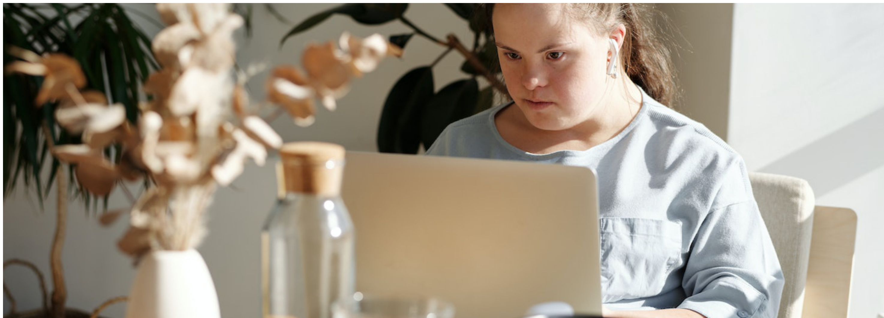
La digitalización, las tecnologías adaptadas y la consolidación del teletrabajo son algunas de las oportunidades para el empleo de las personas con discapacidad, junto a la irrupción de tecnologías que facilitan sus tareas y rutinas..

de territorios, de género, digitales, de edad y de tipos de discapacidades que aumentan las situaciones de exclusión y/o vulnerabilidad de las personas asociadas. La pandemia por COVID se ha traducido en una drástica reducción del número de socios y de cuotas; el cierre de sedes en pandemia; o la suspensión de proyectos, programas y servicios, mientras continuaban generándose gastos de mantenimiento que han sido asumidos en su mayoría con fondos propios, ya sea por no haberse podido cubrir de otra forma o por el retraso de cobro de las subvenciones, la reducción o desaparición de empleo en la mayoría de las asociaciones.