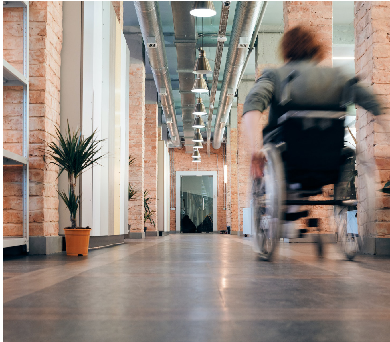
Las personas con discapacidad tienen derecho a trabajar en igualdad de condiciones que las demás.

El término “tercer sector de la discapacidad” es reciente y habla de la realidad específica de las sociedades occidentales contemporáneas y de la formalización moderna de las iniciativas solidarias de la sociedad civil según los contextos socioculturales y como resultado de un proceso de racionalización y organización del tejido social en las sociedades modernas y democráticas. La institucionalización de la solidaridad comunitaria se inicia a partir de los graves conflictos de convivencia que se dieron a finales del s. XIX, sobre todo en Europa, y