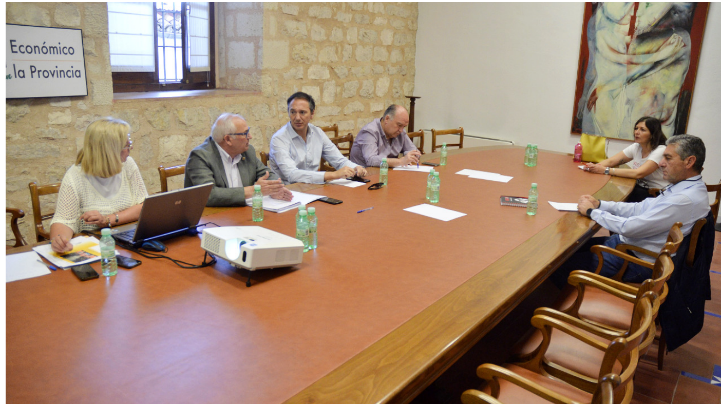
La Comisión Permanente del Consejo Económico y Social de la provincia de Jaén en su reunión mensual celebrada en la Sala de Juntas.

La Comisión Permanente del Consejo Económico y Social de la provincia de Jaén ha celebrado su reunión de abril, en la que ha dado luz verde a varias propuestas de dictámenes que serán aprobadas en el pleno de mayo. La Comisión Permanente del CES ha hecho público su veredicto sobre la empresa ganadora del XXIV Premio Emprende e Innova en Desarrollo Sostenible en la categoría Trayectoria Empresarial que convoca cada año la Diputación Provincial de Jaén para premiar a empresas destacadas en sostenibilidad de la provincia. La empresa Liderkit ha sido la propuesta como ganadora en esta categoría que repasa la trayectoria de producción y éxitos