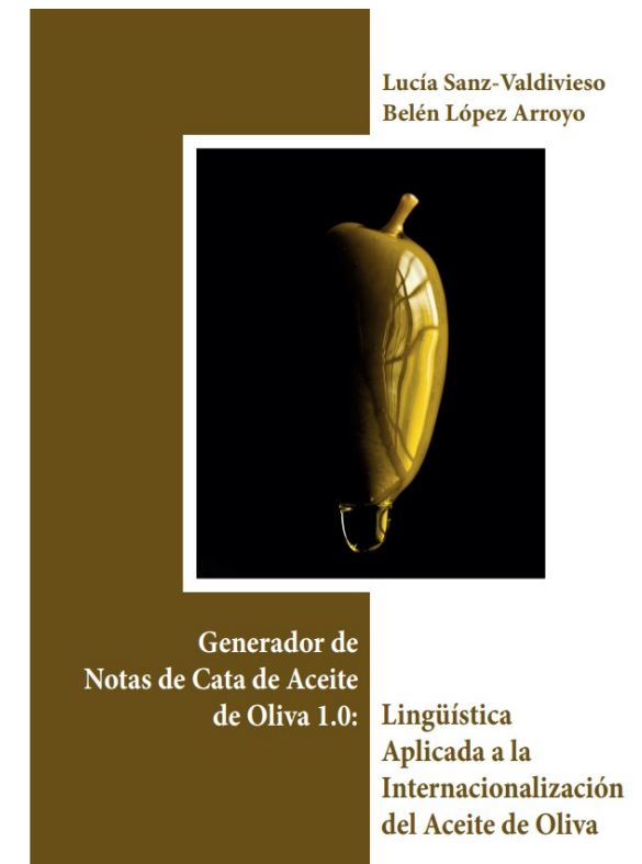
A la izquierda, el trabajo ganador de la anterior edición del premio. A la derecha, la mención especial publicada por el CES Provincial de Jaén.

El CES Provincial y la Fundación Unicaja Jaén han convocado la décima edición de su Premio de Investigación, al que hasta el 31 de octubre de 2023 se podrán presentar trabajos dirigidos a promover y divulgar investigaciones de carácter social, económica o laboral referidas a la provincia de Jaén o que sean de interés para su desarrollo. En este certamen, que cumple este 2023 su décimo aniversario, podrán participar tesis doctorales, trabajos de investigación, proyectos fin de máster o estudios, informes y ensayos, que hayan sido realizados a iniciativa particular, o bien de forma grupal. El trabajo deberá ser original e inédito y habrá de suponer