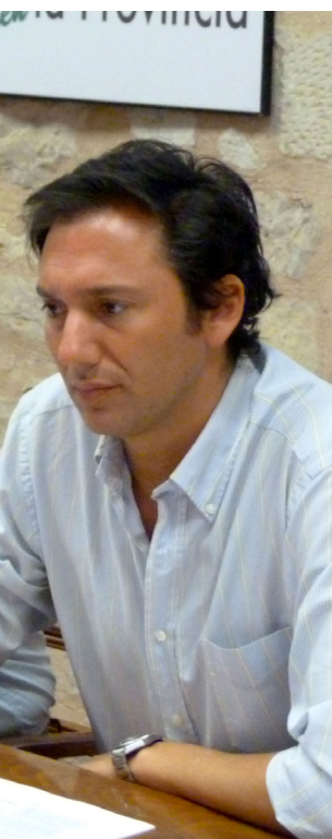
...sidentes del CES Provincial.