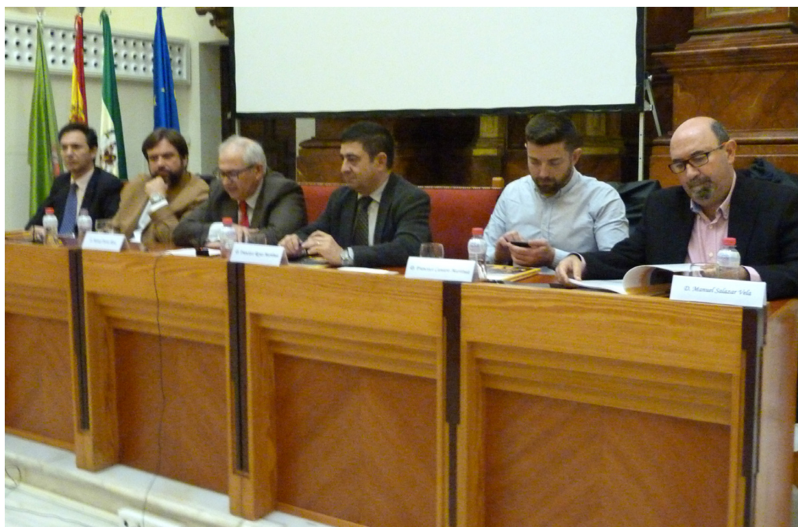
Presentación de la Memoria sobre la Situación Socioeconómica y Laboral de la Provincia de Jaén en 2017.