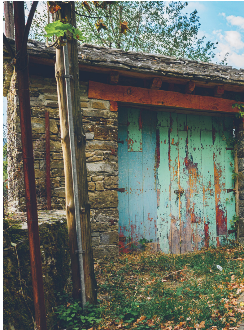
La despoblación marca decisivamente a una enorme parte del territorio español.