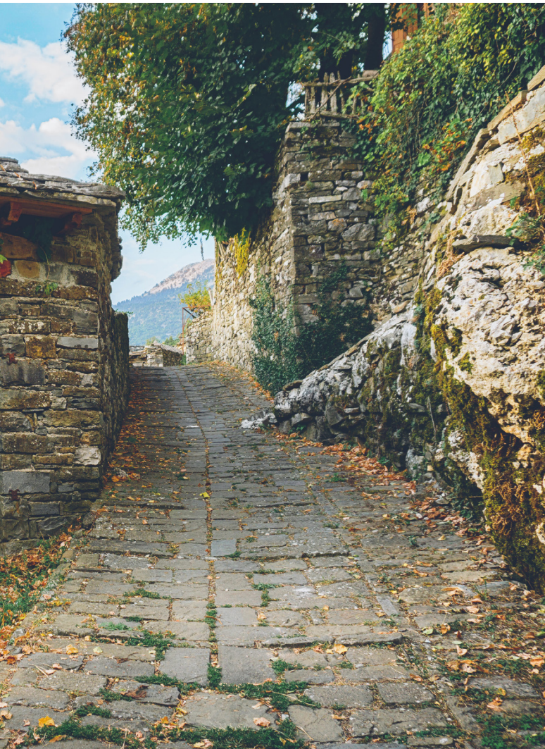
ñol y a más de la mitad de sus municipios.