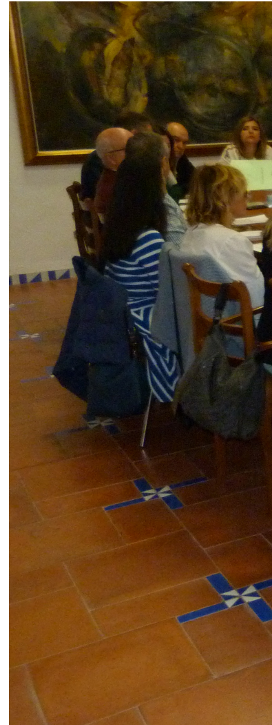
Una imagen del Pleno del Consejo Económico y Social de Jaén.

Desde el mismo instante en que el CES Provincial de Jaén comenzó a dar sus primeros pasos, vemos el interés de este órgano por convertirse en un espacio para las ideas y el debate, donde se pudieran expresar las preocupaciones y las peticiones de los distintos agentes socioeconómicos, buscando ser